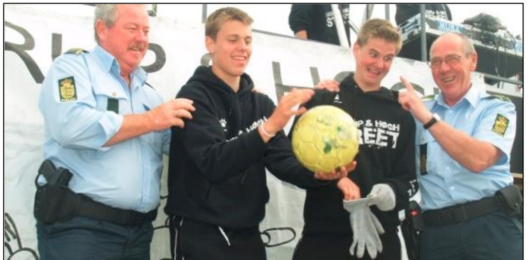
Freestylers fra Laudrup & Høgh har tidligere besøgt Helsingør. Nu er de her igen i forbindelse med Helsingør Messen. Gæt selv, hvem der repræsenterer Laudrup & Høgh Street.!

HSU stand er placeret umiddelbart til venstre for scenen i hal 1, så der skulle være gode muligheder for lidt opmærksomhed på såvel Helsingør Sports Union som idrætsforeningerne i kommunen.