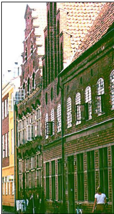
Kultur- & Fritidsforvaltningens nye domicil i Stengade 72 og dermed også nyt hjemsted for Helsingør Sports Unions sekretariat.

Telefonnummer og mailadresse er uændret. Flytningen betyder, at sekretariatet er lukket i perioden 27. marts til 5. april 2010 – begge dage inklusiv.