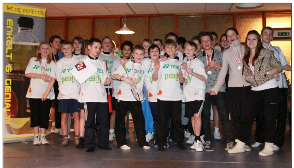
Ungdommelige "Natteravn" fra kommunens mange badmintonklubber

Det efterlader så blot et enkelt spørgsmål: "Hvem skal så gå rundt i byens natteliv iført gule jakker for at hjælpe andre unge?"