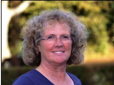
Dot Preil Økonomi Forening: Kronborg Knights

Helsingør Sports Unions bestyrelse består naturligvis af flere medlemmer. Herunder kan du se hvem og hvilken forening de repræsenterer.